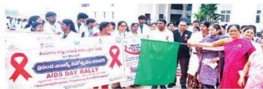
అవగాహన ర్యాలీలో జిల్లా వైద్య అధికారి

Rally began from Neelima Institute of Medical Sciences. DMHO Medchal Malkajgiri, Deputy DMHO, the Dean and Faculty of Neelima Institute of Medical Sciences; Head of the department, NSS & NCC and co-ordinators, Anurag University; volunteers of several NGOs working for HIV/AIDS, Medical and Engineering students of Anurag University participated in the rally. Placards were displayed on HIV awareness in surrounding community.